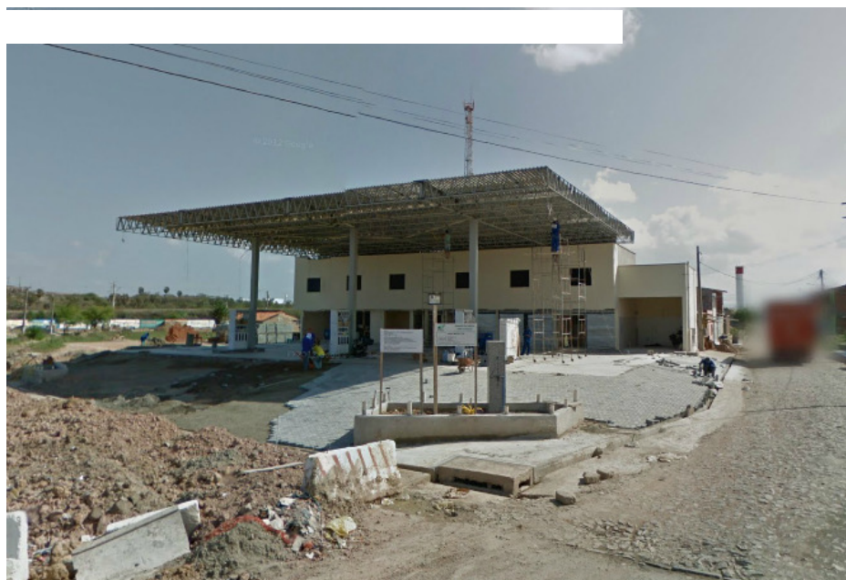
Figura 2 – Construção

Foram instalados quatro tanques de combustíveis: um de trinta metros cúbicos, um de vinte metros cúbicos e um de quinze metros cúbicos, e um de dez metros cúbicos para que se possa dar início a execução das obras de pavimentação e construção civil, inicialmente foi comprado um elevador para troca de óleo, um compressor, dois calibradores, filtro de diesel, três bombas octuplas, um veed-root (aparelho de medição do volume dos tanques), moveis para escritório, três geladeiras, uma copiadora/scanner, e cinco computadores.