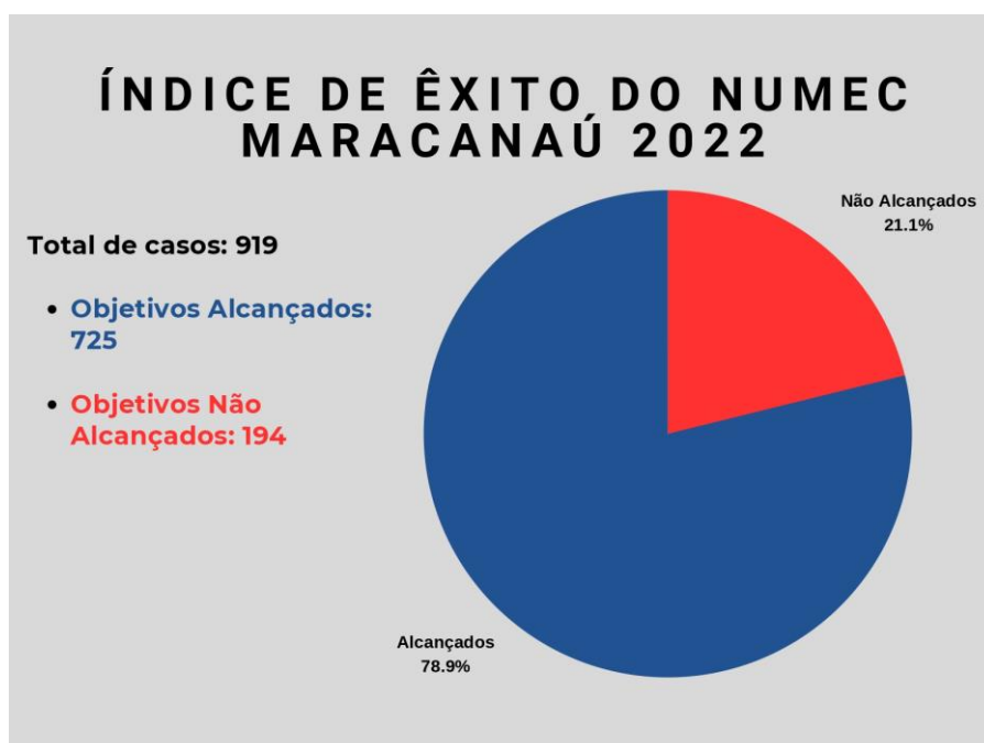
GRÁFICO 2 - ÍNDICE DE ÊXITO NUMEC MARACANAÚ 2022

No gráfico 1 demonstra que o NUMEC de Maracanaú realizou 919 (novecentos e dezenove) atendimentos, dos quais 291 foram de abertura de procedimentos de mediação, 147 pré-mediações, 127 sessões de mediação, 338 orientações e/ou encaminhamentos e 16 ações diferenciadas.