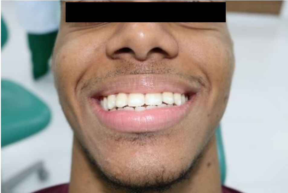
Figura 1. Aspecto inicial com manchas brancas opacas de pré-molar a pré-molar.

Após exame radiográfico, sessão fotográfica os procedimentos clínicos foram iniciados, primeiramente com a profilaxia, utilizando escova de Robson Reta (Microdont®, São Paulo-SP, Brasil), acoplado em micromotor e baixa rotação (KaVo®, Joinville, Santa Catarina, Brasil) e uso de pasta profilática (Maquira®, Maringá, Paraná, Brasil). Após a profilaxia realizou-se o isolamento absoluto do dente 14 ao 24 utilizando os grampos 208 e 209 (SS White Duflex®, Rio de Janeiro-RJ, Brasil), grampo 208 para o elemento dentário 14 e 209 para elemento 24, Arco de Yong Metal (Ortcentral®, Poá, São Paulo, Brasil) e lençol de borracha (Maideitex®, São José dos Campos, São Paulo, Brasil) o qual foi perfurado com Alicate Perfurador Ainsworth (Golgran®, São Paulo-SP, Brasil), logo depois o grampo foi inserido no lençol de borracha e levado a cavidade bucal com a Pinça Porta-Grampo Palmer (Golgran®, São Paulo-SP, Brasil), em seguida foi realizado amarras cervicais (Figura 2).