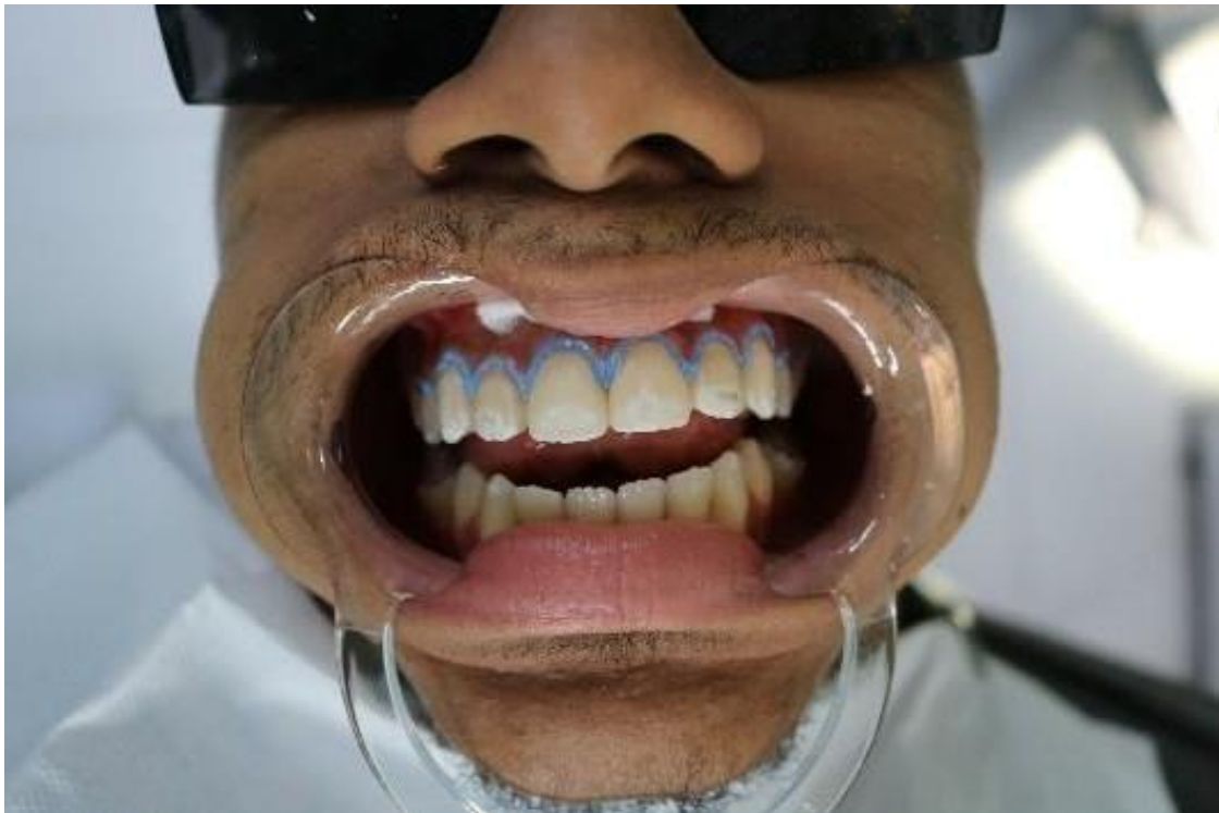
Figura 5. Isolamento Relativo.

verificação foi fotopolimerizado por 20 segundos com o fotopolimerizador (Dabi Atlante®, Ribeirão Preto, São Paulo, Brasil) para cada grupo de 3 dentes (Figura 5), utilizou-se a placa de mistura do kit e misturou a proporção de 3:1 sendo 15 gotas de peróxido com 5 gotas de espessante, com auxílio de um microbrash o gel foi aplicado sobre a superfície dental e permaneceu por 45 minutos (Figura 6), após os 45 minutos o gel foi sugado e lavado abundantemente (Figura 7), em seguida removeu-se o top dam com uma sonda explorada n°5 (Golgran®, São Paulo-SP, Brasil), realizou-se o polimento do esmalte dentário com disco de feltro Diamond Flex e pasta de polimento Diamond Excel, ambos FGM® (Dentscare Ltda, Avenida Edgar Nelson Meister, 474, Joinville, Brasil) e aplicação tópica de flúor. Foi necessário realizar uma segunda sessão de clareamento para se obter o resultado desejado, diante disto, a segunda sessão foi realizada seis dias após o primeiro clareamento, seguindo o protocolo descrito anteriormente (Figuras 8-11).