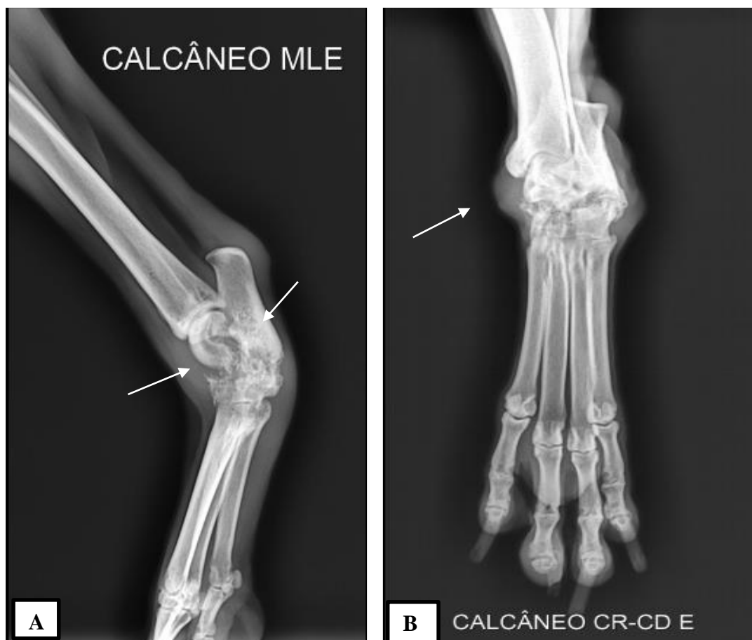
Fig. 3: Radiografia de calcanhar esquerdo. A. Projeção médio lateral esquerda. B: Projeção crânio-caudal esquerda.

processo inflamatório/derrame articular. Houve manutenção da relação articular tibiotársica esquerda e metatarsos e falanges esquerdas sem sinais de alterações morfológicas ou topográficas. As impressões diagnósticas foram sugestivas de osteomielite em tarsos esquerdos e o diagnóstico diferencial inclui processo neoplásico (Fig. 3 A e B).